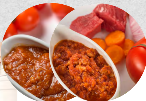
SALSA BOLONYESA ORIGINAL