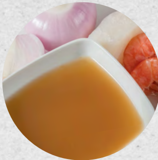
FUMET DE PEIX