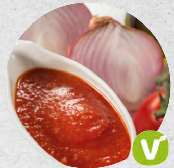
SALSA DE TOMÀQUET