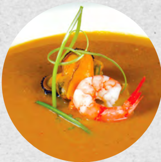
SOPA DE PEIX

Podem descongelar les salses a la nevera el dia abans de cuinar-les, al microones o bé al bany Maria; durant un minut i mig.