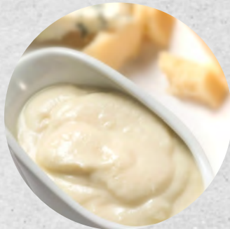
SALSA 4 FORMATGES