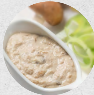
SALSA FUNGHI PORCINI