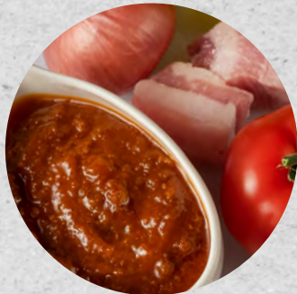
SALSA PER CARGOLS